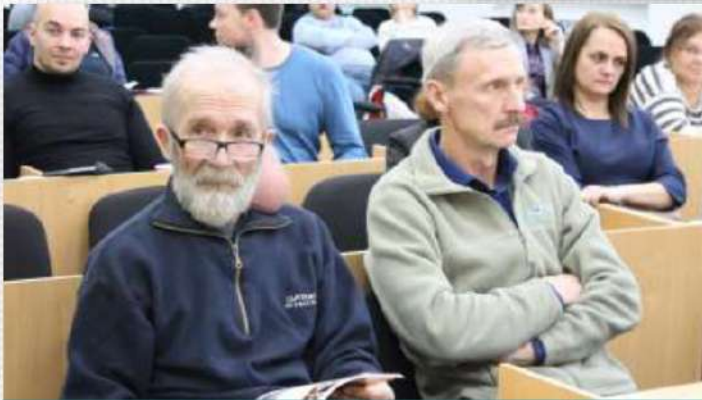
Сход граждан и ПЭК