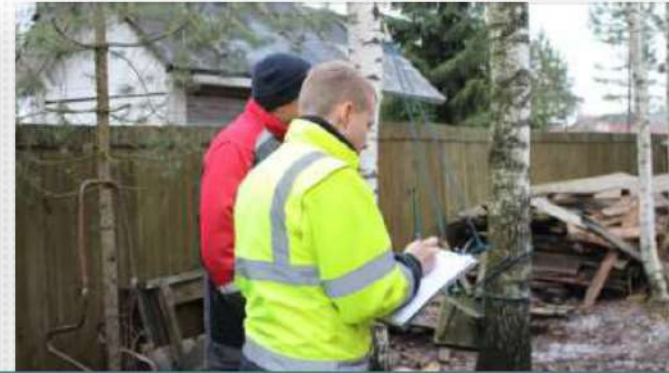
Беседы с владельцами