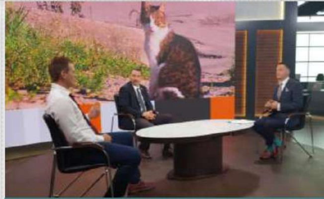
СМИ и сайт